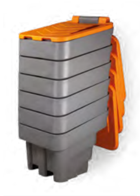
контейнеры в штабеле