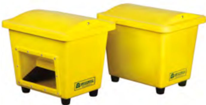
SBA 110 с отверстием для лопаты / без отверстия для лопаты

Контейнеры изготовлены из стеклопластика с высокой стойкостью к механическим, атмосферным и химическим воздействиям. По желанию заказчика на контейнеры наносятся логотипы, надписи, числа в цветовом исполнении на выбор заказчика. Срок гарантии на контейнеры – 5 лет.